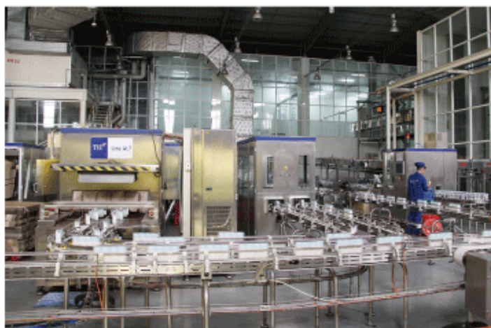
欧州のオートメーション技術を導入して24時間フル生産をするTHミルクの工場＝ゲアン省

THファームでは、乳牛を管理するためにイスラエルの乳業向けITソリューションを提供するアフィミルクのシステムを導入している。「レッグタグ」と呼ばれるセンサーを脚に付けてWiFi（ワイファイ）で、歩数などのデータをクラウド上で管理する仕組み。第8農場では、最新型のシステムの導入により1時間ごとに牛の熱感知ができる。これは健康状態や発情期を知ること、受胎率を高める狙いがある。最新技術で分娩を感じて、携帯端末にアラートする機能も搭載した。