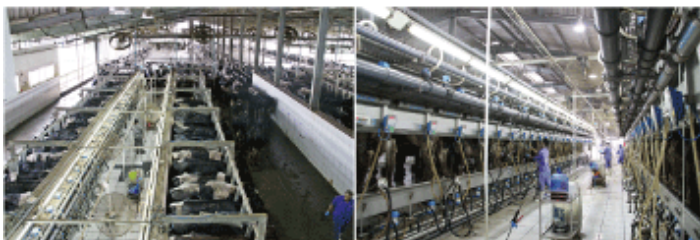
【左】各ミルクパーラーで同時に120頭の搾乳が可能【右】ミルクパーラーで搾乳した生乳の成分は、データ化されてクラウドに送られる＝ゲアン省

搾乳から製品の製造工程もオートメーション化されている。8カ所の酪農場にあるミルクパーラー（搾乳専用施設）では、1回120頭を同時に搾乳できる。搾乳は1日3回。THファームの平均搾乳量は1頭当たり1日27~28リットル。ここでもアフィミルクの搾乳システムを使い、生乳の電気伝導率によって脂肪やプロテインの量など品質の情報をデータ化している。搾乳した生乳は30秒以内に4度以下に冷やし、バクテリアの繁殖を抑えた上で製造工場へトラックで運ばれる。